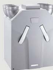
Zehnder ComfoAir 350