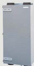
Zehnder ComfoAir 200