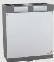
Zehnder ComfoAir 180

■ Voliteľný zemný výmenník: výbornou protimrazovou ochranou je použitie zemného výmenníka. ComfoFond-L, ktorý využíva relatívne konštantné teploty zeminy – vďaka tomu privádzaný čerstvý vzduch v zimnom období predhrieva a v lete veľmi účinne ochladzuje.