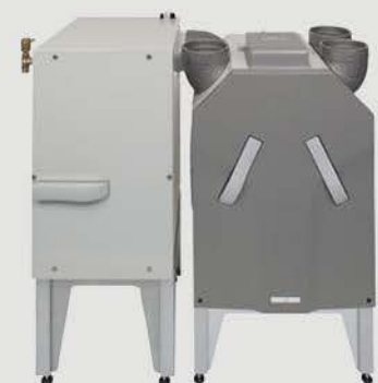
Zehnder ComfoFond-L a ComfoAir 350